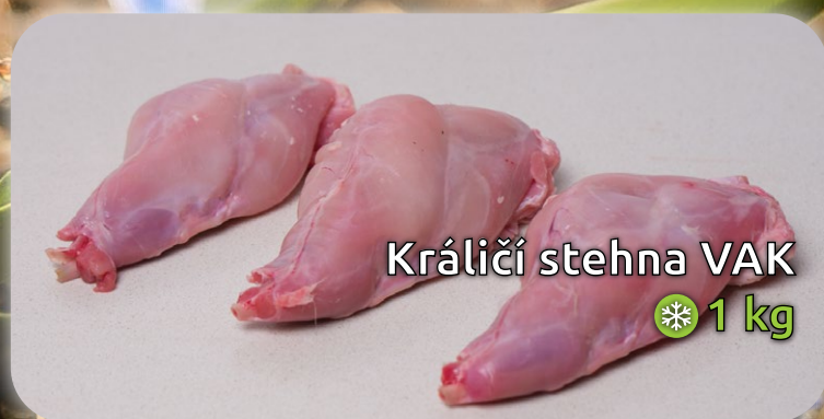
Králičí stehna VAK ❄️ 1 kg