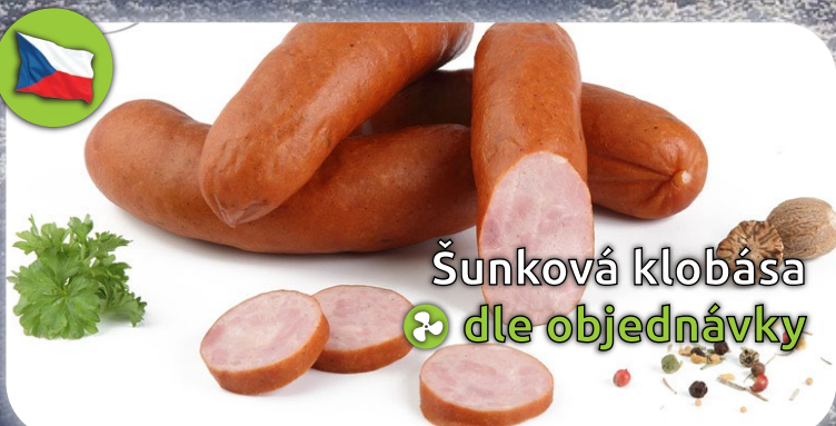
Šunková klobása ❄️ dle objednávky