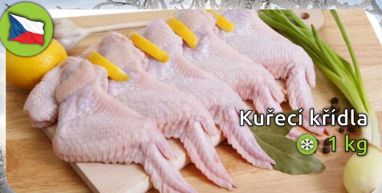
Kuřecí křídla ❄️ 1 kg