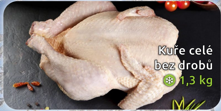
Kuře celé bez drobů ❄️ 1,3 kg