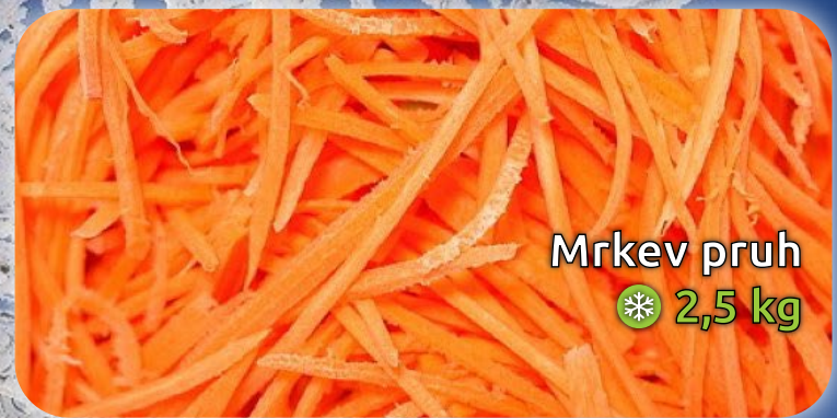
Mrkev pruh ❄️ 2,5 kg