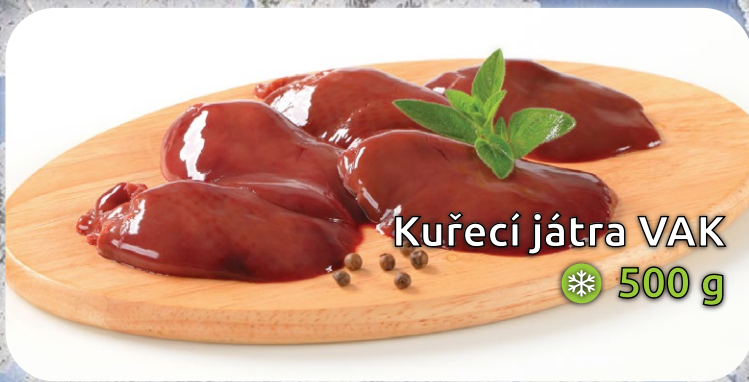
Kuřecí játra VAK ❄️ 500 g