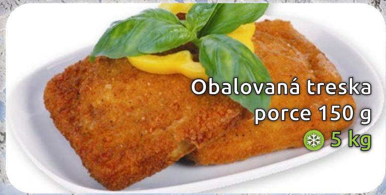
Obalovaná treska porce 150 g ❄️ 5 kg