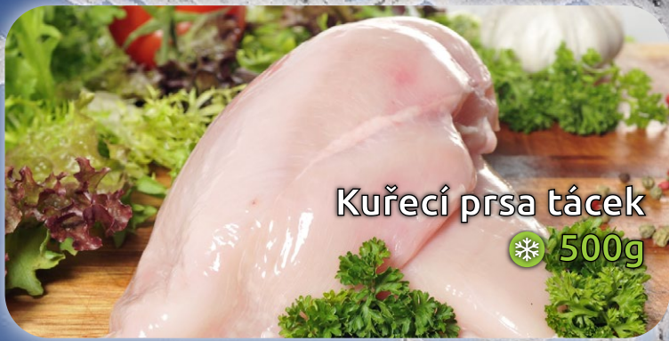
Kuřecí prsa táček ❄️ 500g