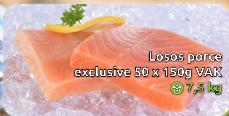
Losos porce exclusive 50 x 150g VAK ❄️ 7,5 kg