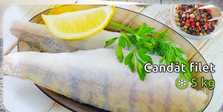
Candát fileť ❄️ 5 kg