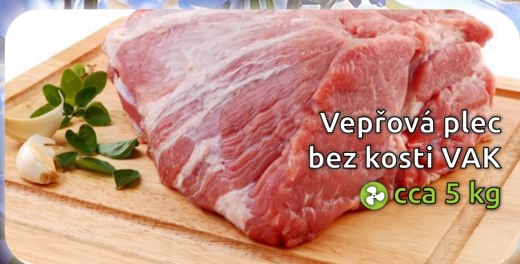
Vepřová plec bez kosti VAK ♻️ cca 5 kg