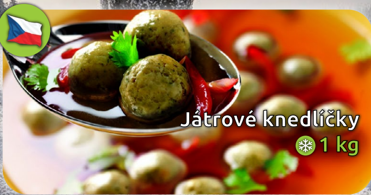
Játrové knedlíčky ❄️ 1 kg