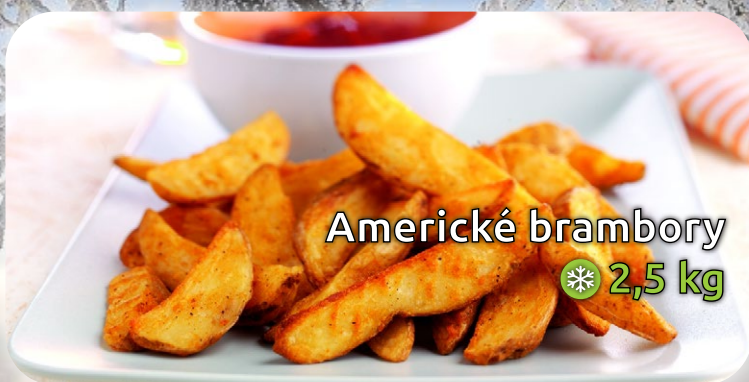
Americké brambory ❄️ 2,5 kg