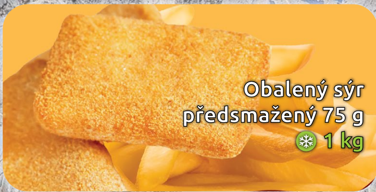
Obalený sýr předsmažený 75 g ❄️ 1 kg