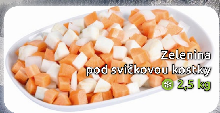
Zelenina pod svíčkovou kostky ❄️ 2,5 kg