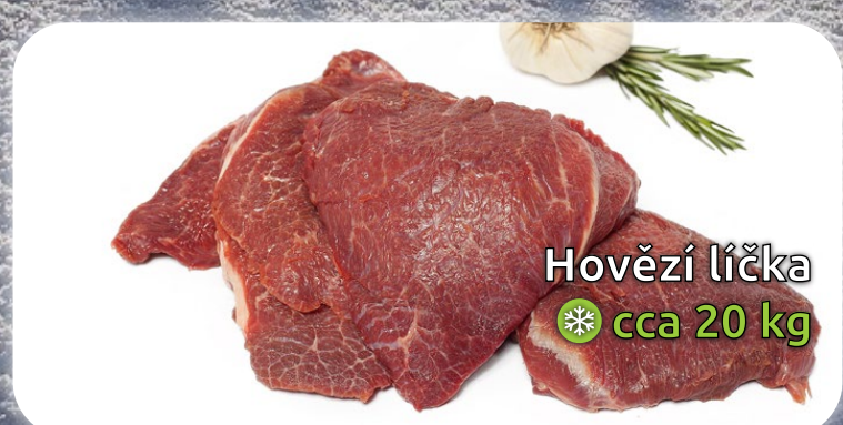
Hovězí líčka ❄️ cca 20 kg