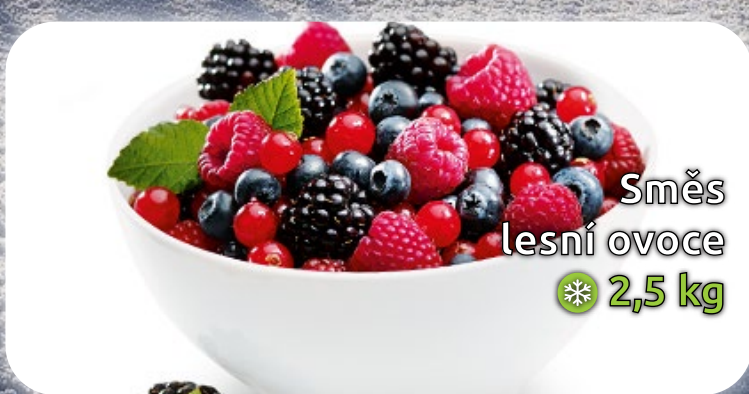
Směs lesní ovoce ❄️ 2,5 kg