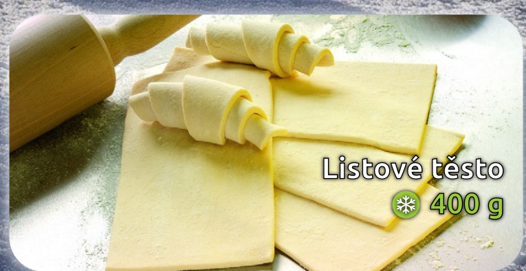
Listové těsto ❄️ 400 g