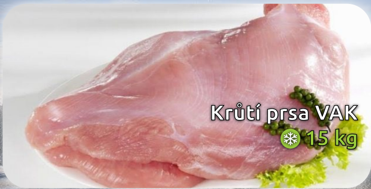
Krutí prsa VAK ❄️ 15 kg