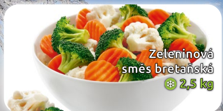
Zeleninová směs bretaňská ❄️ 2,5 kg