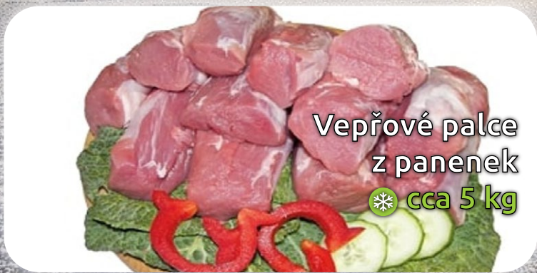
Vepřové palce z panenek ❄️ cca 5 kg