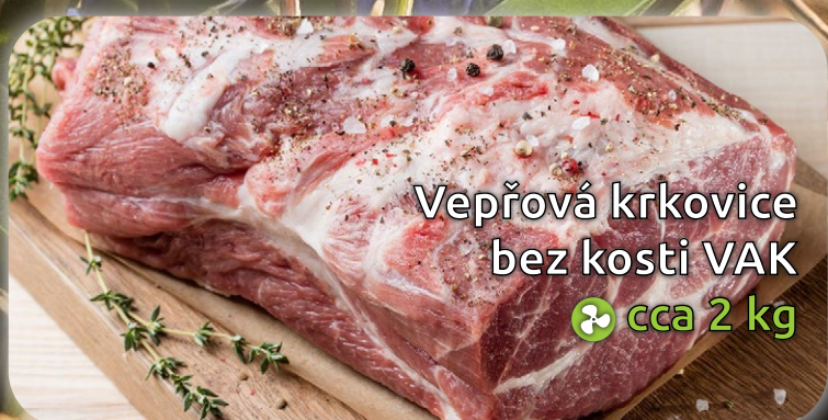
Vepřová krkovice bez kosti VAK ♻️ cca 2 kg