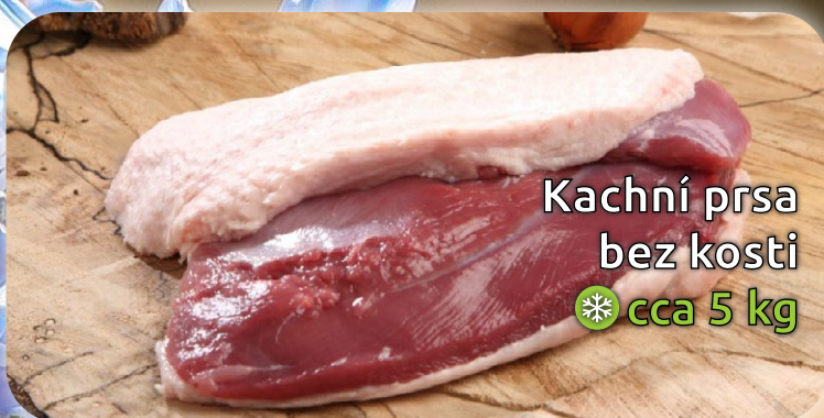
Kachní prsa bez kosti ❄️ cca 5 kg