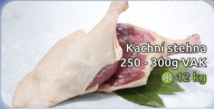
Kachní stehna 250 - 300g VAK ❄️ 12 kg